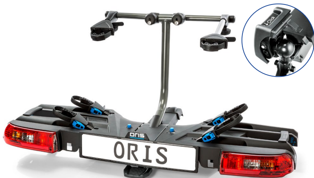
ORIS TRACC Art.-Nr. 700-002

Während der ORIS TRACC FIX4BIKE® -Träger nur auf eine FIX4BIKE® -Anhängerkupplung passt, ist die FIX4BIKE® -Anhängerkupplung für alle gängigen Fahrradträger kompatibel.