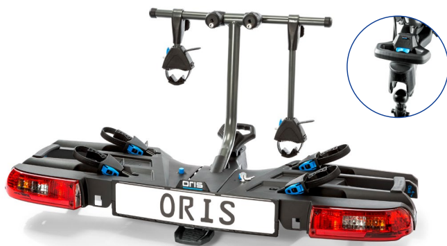
ORIS TRACC FIX4BIKE® Art.-Nr. 710-002